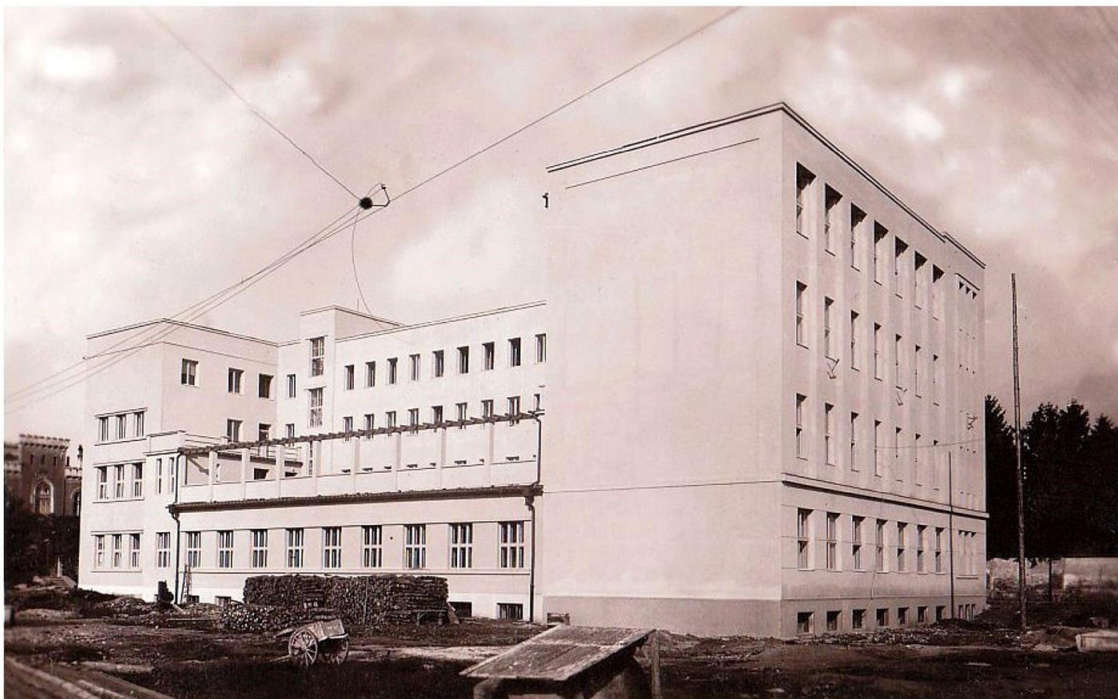
Novostavba internátu z roku 1937.